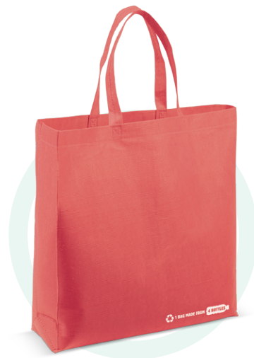
95196 R-PET tas, 38x42x10cm

Vier gerecyclede PET flessen zijn hergebruikt voor het materiaal van deze tas. Help met deze tas mee om het plastic afval te verminderen. Door de volledige bodem en zijkant is dit model extra groot. Afmeting: 380x100x420mm.