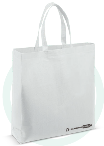
95181 R-PET tas, 38x42x10cm (wit)

Vier gerecyclede PET flessen zijn hergebruikt voor het materiaal van deze tas. Help met deze tas mee om het plastic afval te verminderen. Afmeting: 380x100x420mm.